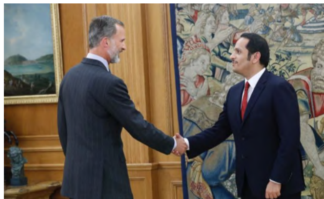
SM el Rey recibe el saludo del vice primer ministro y ministro de Asuntos Exteriores del Estado de Qatar, su excelencia el Jeque Mohammed Bin Abdulrahman Al-Thani. - Palacio de La Zarzuela. Madrid, 13.09.2018.

En marzo de 2023, la renuncia del Primer Ministro Jeque Khalid Al Thani provocó una remodelación gubernamental. El Jeque Mohammed Al Thani fue nombrado nuevo primer ministro, compatibilizando el nuevo cargo con su cartera de Ministro de Asuntos Exteriores. La cartera de Interior se separó de la oficina del Primer Ministro y se nombró al Jeque Khalifa Al Thani al frente de dicho ministerio. En enero de 2024, y ya bajo el mandato del nuevo Primer Ministro, se produjo una nueva remodelación que afectó a cinco carteras ministeriales.