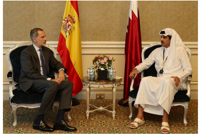
Reunión entre Felipe VI y el emir de Qatar.-Doha 23/nov/2022.-foto: CASA DE S.M. EL REY

Sus principales exportaciones en el primer trimestre de 2024 alcanzaron los 24,06 MM$. Se dirigen a Asia (81%), CCG (8,9%) y UE (6,7%). Los principales valores de exportación por país entre enero y febrero de 2024 corresponden a China (4.020,50 MUSD, Corea del Sur (2.386,31 MUSD), India (1.978,18 MUSD), Singapur (1.163,55 MUSD) y Japón (1.068,44 MUSD). Los principales productos exportados son gases de petróleo y otros hidrocarburos gaseosos (por valor de 10.213,51 MUSD), aceites de petróleo crudos (2.582,57 MUSD) y aceites de petróleo no crudos (1.011,43 MUSD).