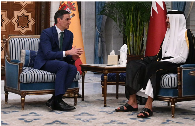
El presidente del Gobierno, Pedro Sánchez, en su encuentro con el emir de Qatar, Tamim Bin Hamad Al Thani. Doha (Catar) 3.4.2024

En 2022 en España hay 931 empresas exportadoras regulares, lo que supone un incremento del 1% con respecto a 2021. Por otro lado, el número de empresas regulares importadoras pasó de 38 a 39 en 2022, suponiendo un incremento del 3%, aunque una notable diferencia de las 45 que había registradas en 2019.